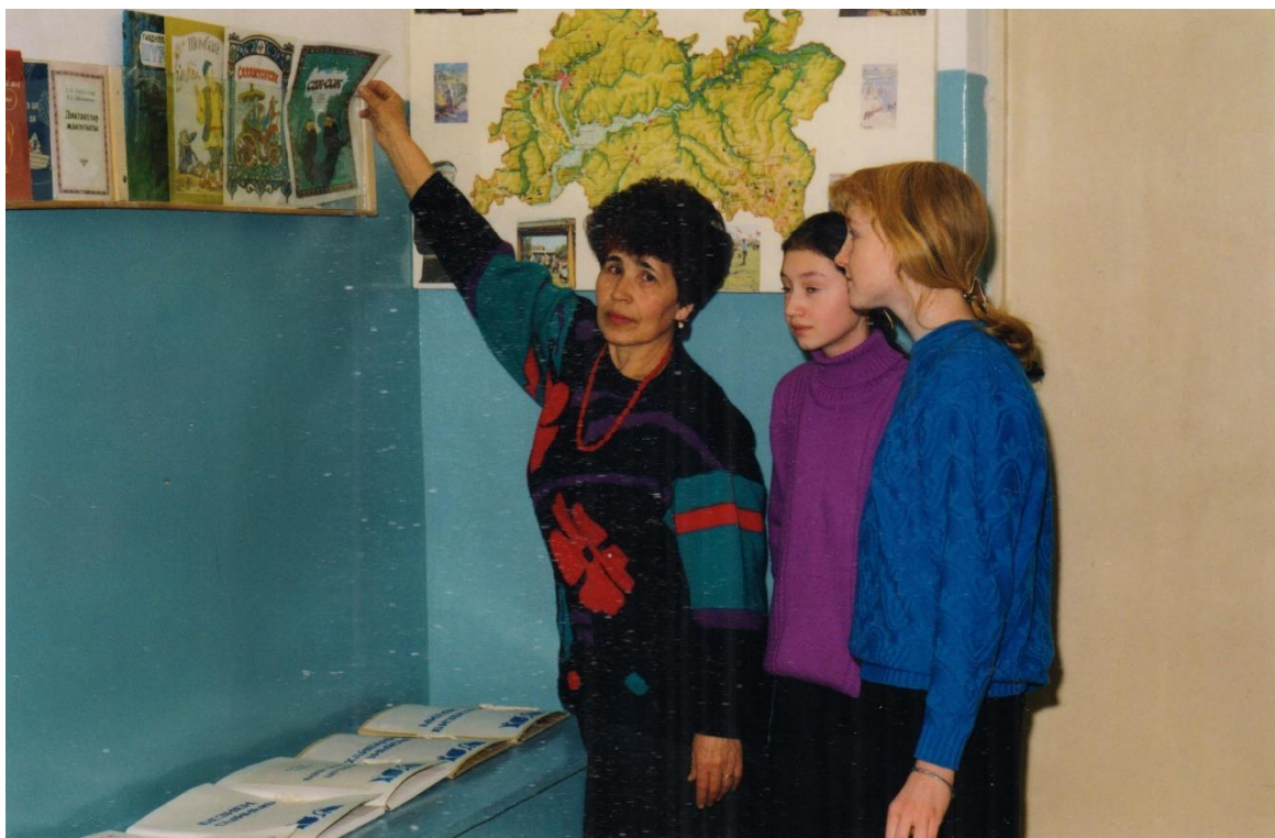
1995 год. На уроке родной литературы в 8 классе.